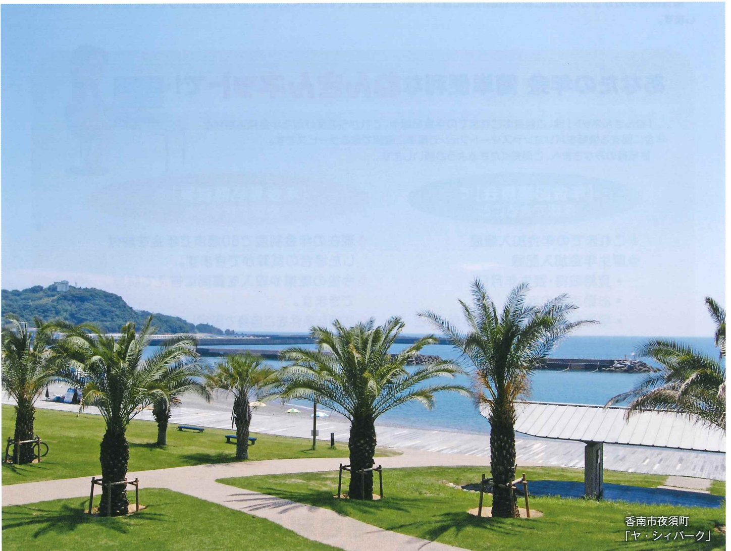
香南市夜須町 「ヤ・シパーク」