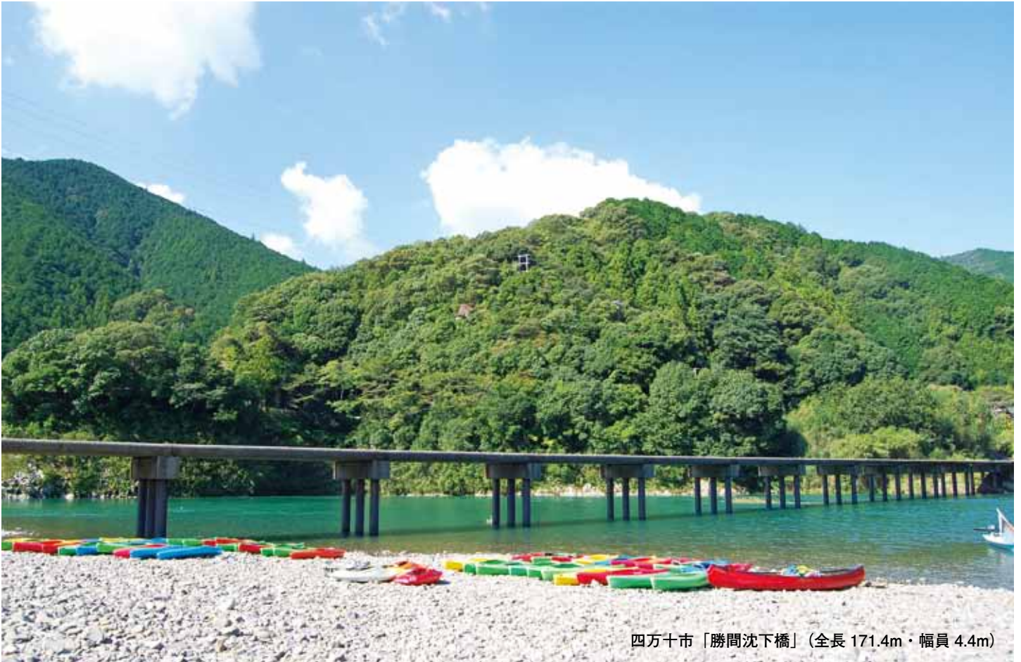
四万十市「勝間沈下橋」(全長 171.4m・幅員 4.4m)