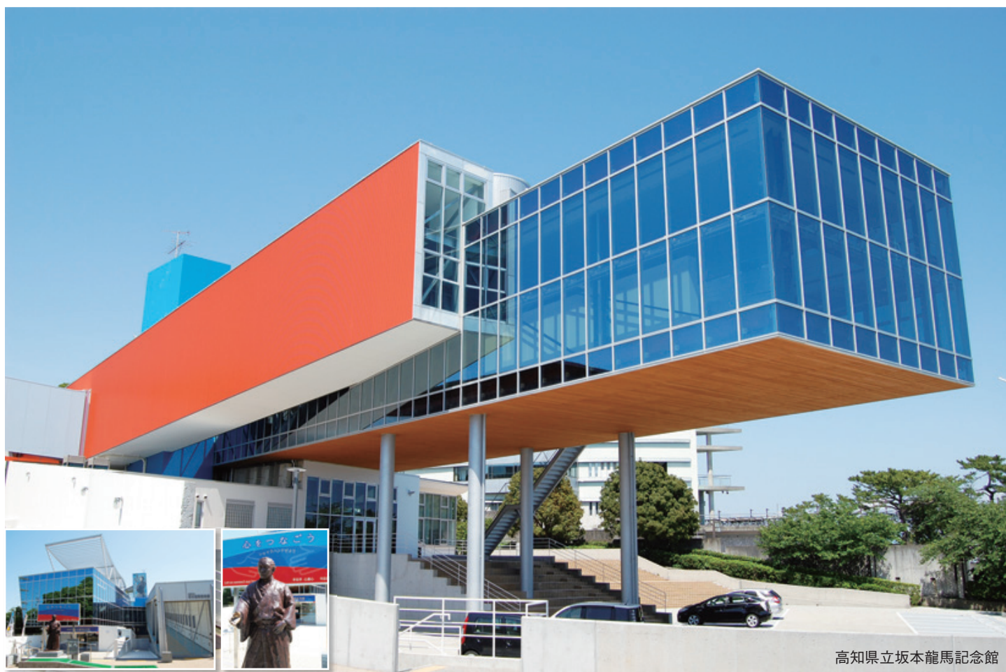
高知県立坂本龍馬記念館