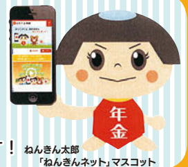
ねんきん太郎 「ねんきんネット」マスコット