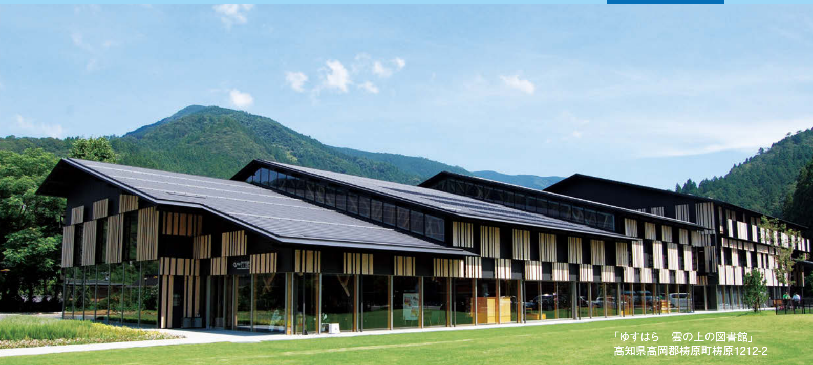
「ゆすはら 雲の上の図書館」 高知県高岡郡梶原町梶原1212-2