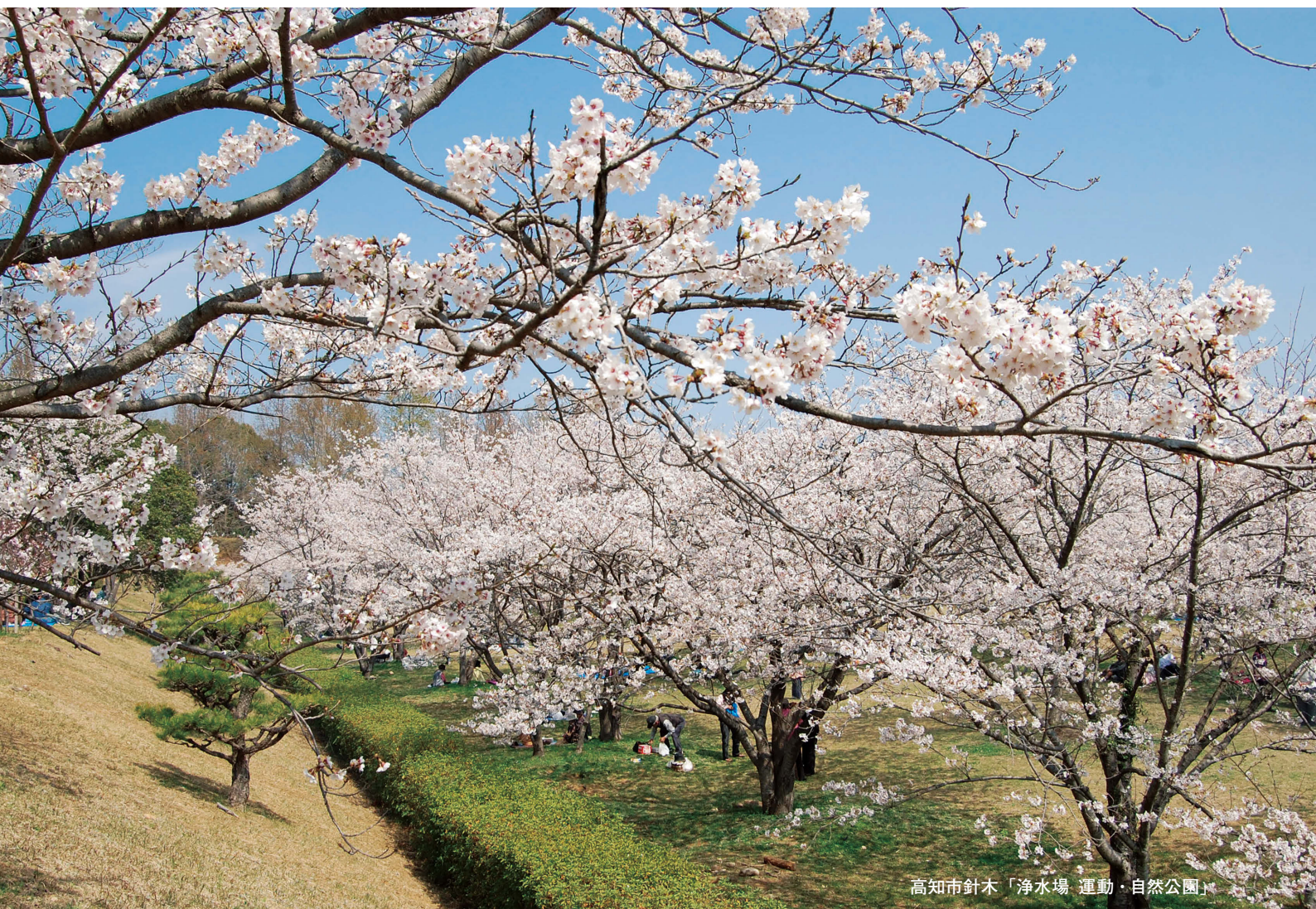
高知市針木「浄水場 運動・自然公園」