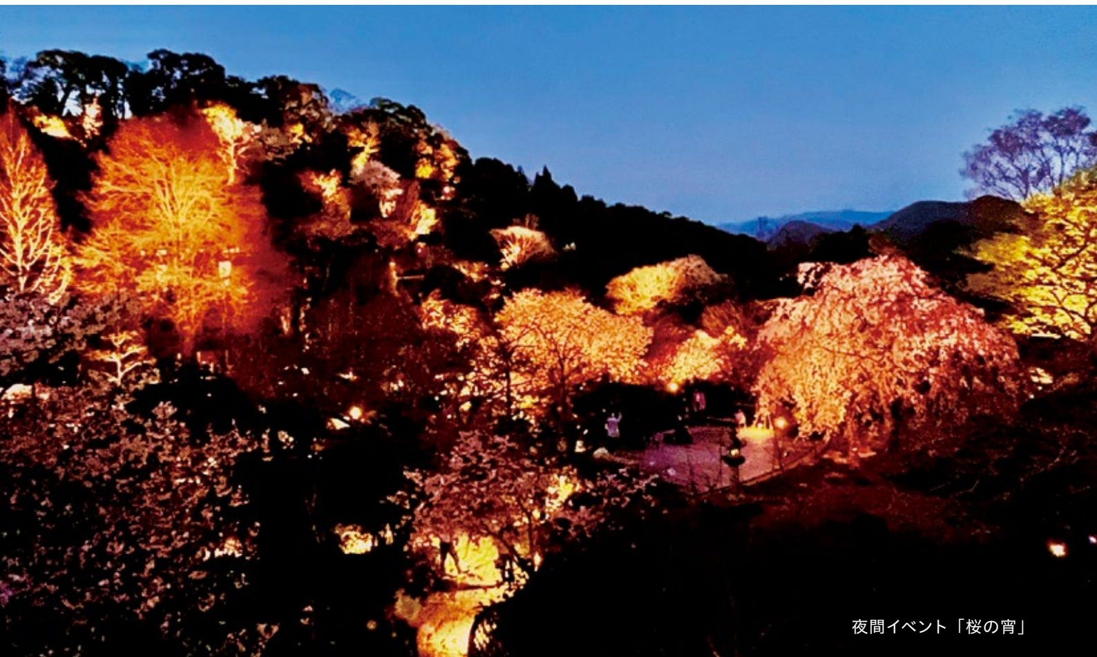
夜間イベント「桜の宵」