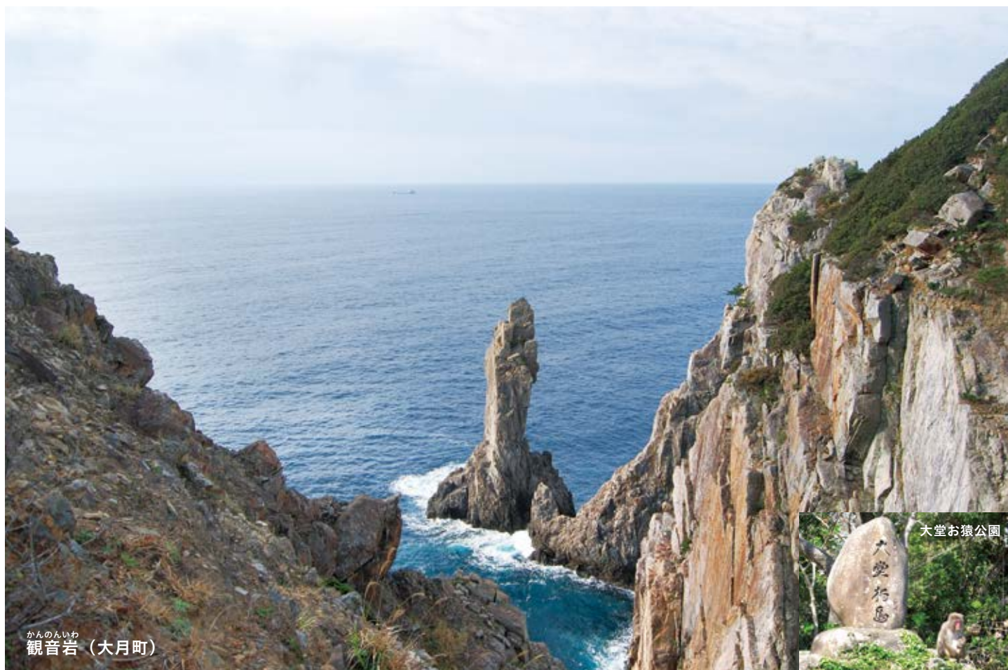
かんのんいわ 観音岩（大月町）