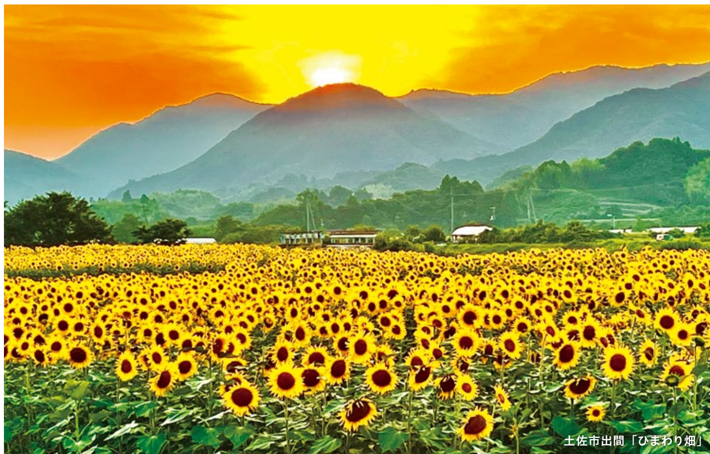
土佐市出間「ひまわり畑」

ひまわりといえば、一般的に7月下旬から8月頃に見頃を迎えますが、土佐市出間では6月中旬から下旬と、10月下旬から11月上旬の年2回、一面にひまわりが咲き誇る時期があります！前半を「早咲きのひまわり」、後半を「遅咲きのひまわり」とそれぞれ呼びます。早咲きのひまわりは背が高く、遅咲きのひまわりは背が低い点の特徴！ひまわりを持ち帰る（有料）こともできます。また、毎年10月の最終週の土日には、花フェスタが開催され、ひまわり畑の横でさまざまな露店が並びます。広大な敷地の一面に広がるひまわりは圧巻です！