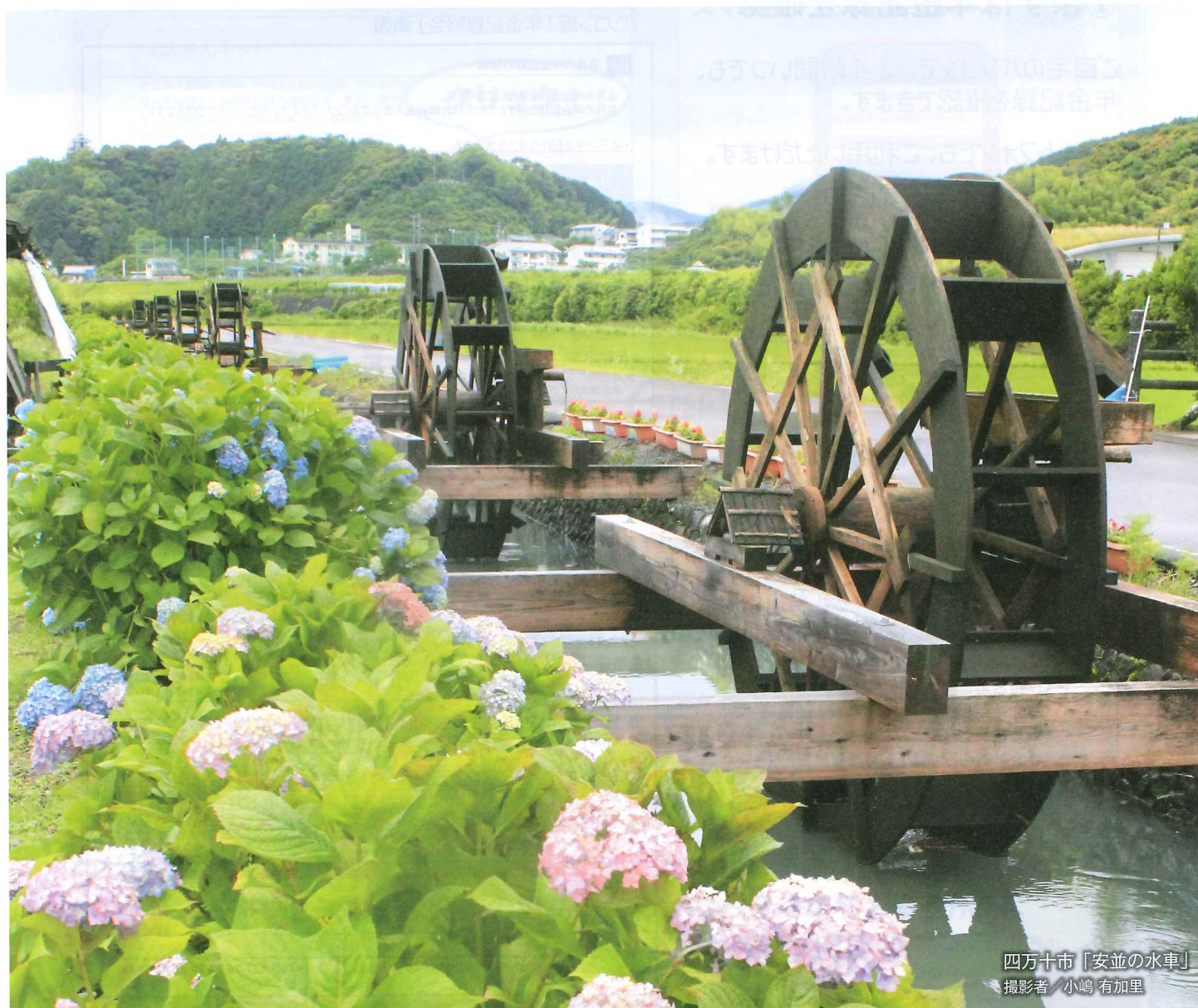
四万十市「安並の水車」