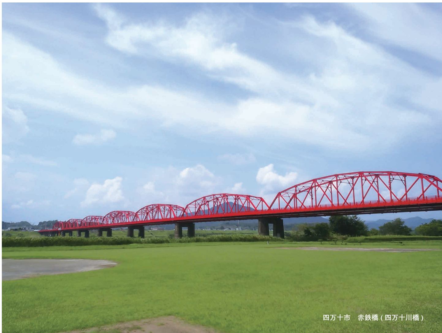
四万十市 赤鉄橋（四万十川橋）