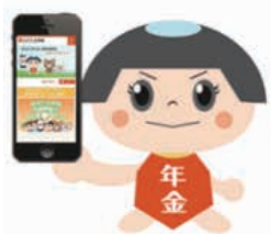
ねんきん太郎 「ねんきんネット」 マスコット

お申し込みは年金手帳をお手元にご準備の上、日本年金機構ホームページよりお願いします